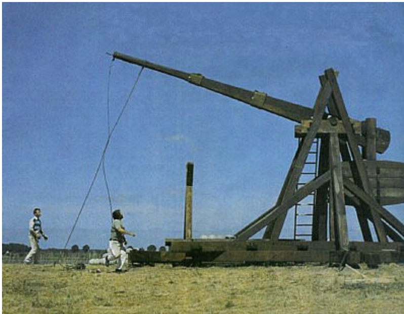
Bild 3: Nachbau einer Blide anlässlich der 700 Jahrfeier der Stadt Nykøbing, Dänemark (1989)

Sie zogen also vor die besagten Mauern und bauten vor Ort einige Bliden, welche 150 Kilogramm schwere Steine bis zu 60 Schritt zu werfen vermochten. Der Chronist berichtet, dass die fliegenden Steine ein Geräusch wie ein Sturmwind verursachten. Damit konnten die Mauern innert kurzer Zeit gebrochen werden.