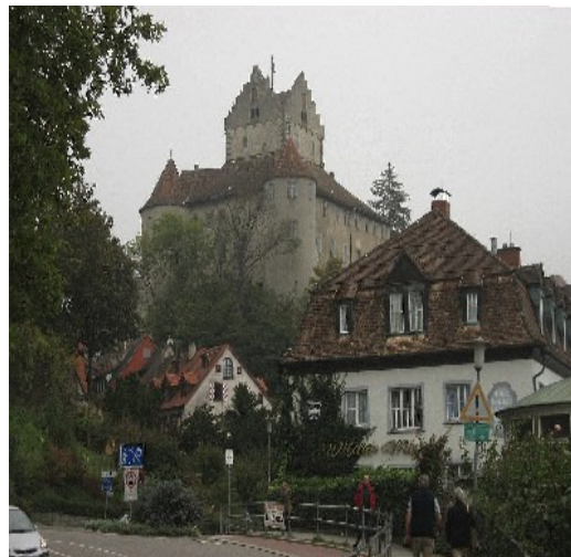
Fig 5: Meersburg am Bodensee, wo im Jahre 1334 zum ersten Mal in der Weltgeschichte Kanonen zum Einsatz kamen.

Die älteste Quelle betreffend Berthold Schwarz ist ein anonymes Feuerwerkerbuch aus dem Jahre 1420. Berthold wird hier "Niger Berchtoldus" genannt, was "Berchtold der Schwarzkünstler" heisst".