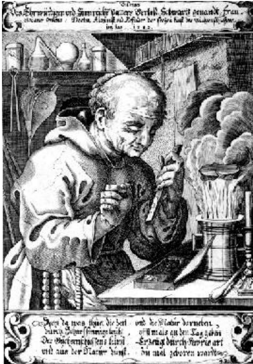
Bild 4: Dieser Kupferstich aus dem Jahre 1640 ist überschrieben: "Des ehrwürdigen und sinnreichen Vatters Berthold Schwarz genannt, Franziskaner Ordens, Doctor, Alchemist und Erfinder der freien Kunst des Büchsen schiessens".

Etwas Wahres wird also an der Sache sein. Der erste geschichtlich bezeugte Einsatz von Kanonen geschah zur Verteidigung von Meersburg am Bodensee, Sitz des Freiburger Bischofs Nikolaus I, im Jahre 1334. Berthold mag ein Zeuge dieses Gefechts gewesen sein oder massgeblich an der Entwicklung dieser Geschütze beteiligt gewesen sein. Doch als Erfinder des Schwarzpulvers kommt er nicht in Frage. Dies wurde seiner Person auch erst in neuerer Zeit zugeschrieben. Auch ist das Schwarzpulver sowenig nach ihm benannt (was hauptsächlich Deutsche glauben) wie die Bratpfanne eine Erfindung des Herrn Brat war. Der Begriff "Schwarzpulver" taucht erst um 1890 auf, um es vom weissen Nitropulver zu unterscheiden. Zuvor bezeichnete man es einfach als "Pulver" oder allenfalls als "Schiesspulver"